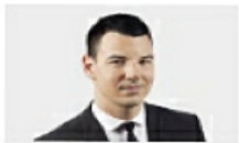
HUGO DUMAS La Presse